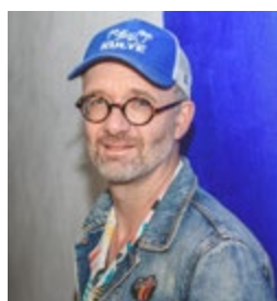
LE CIL VERT